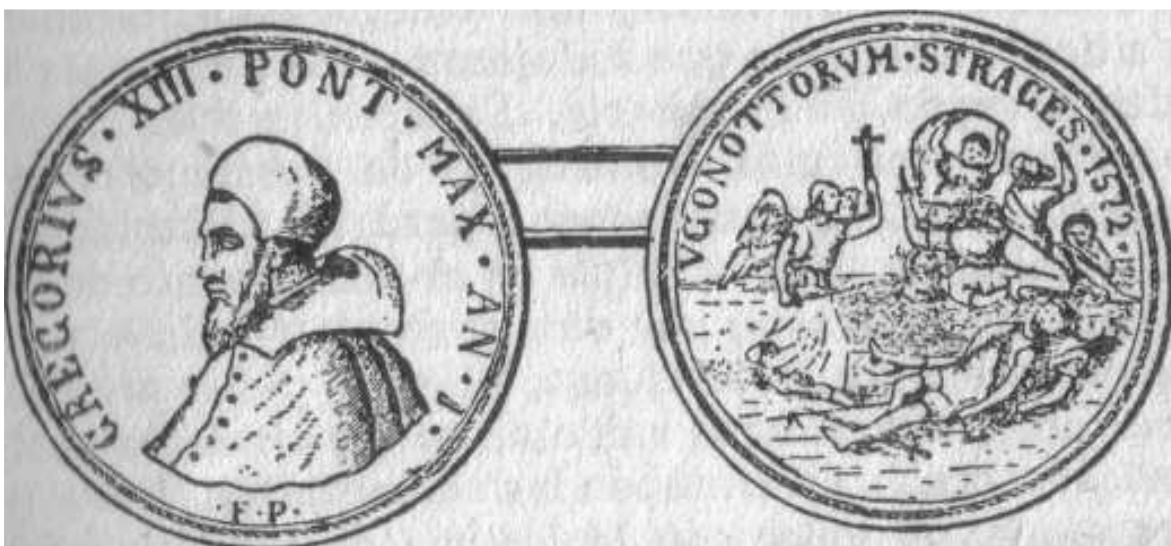
El papa Gregorio XIII.

Esta monstruosa carnicería, perpetrada a favor de una traición infame, arrancó un inmenso grito de horror a toda la cristiandad evangélica. Pero el papa Gregorio XIII triunfaba. Hizo cantar un Te Deum, y para perpetuar el recuerdo de este sangriento auto de fe, hizo acuñar una medalla con la inscripción siguiente